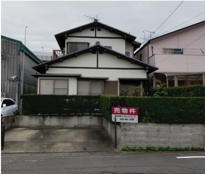
外壁塗り替え・駐車場2台可能